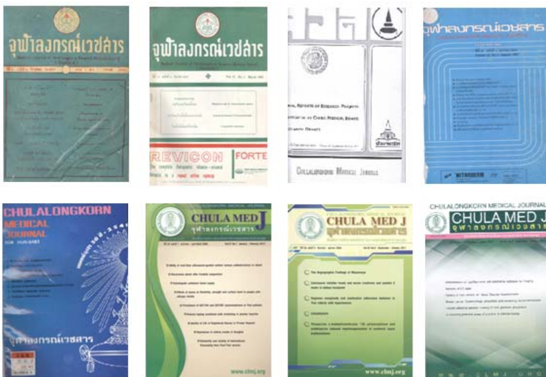
รูปที่ 2. ปกจุฬาลงกรณ์เวชสารในช่วง 60 ปีที่ผ่านมา (วารสารระดับชาติ)